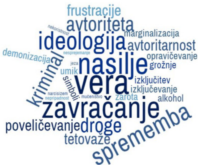
Slika 3: Izris skupnih vedenjskih indikatorjev radikalizacije